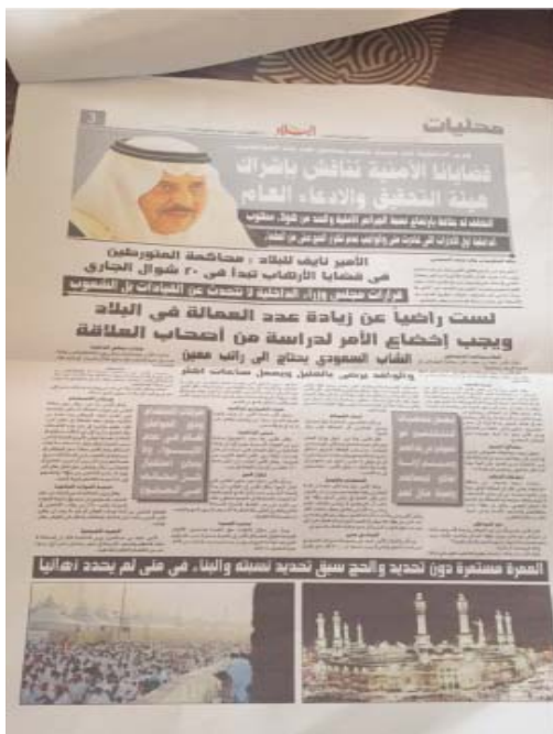
حديث الأمير لبلداد