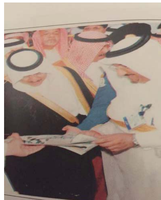
مع الأمير عرافات ١٤٢٧هـ