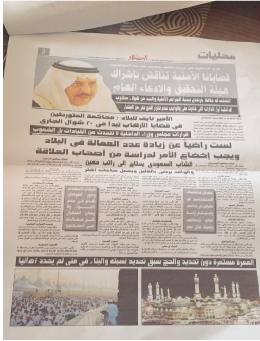
حديث الأمير للبلاد

وتكررت الفرصة اثناء دفن الأمير في مكة المكرمة اذ انفردت البلاد بالصورة التي قمت بتصويرها بجوالي الخاص اثناء دفن الأمير ونشرت في الصفحة الاولى الثلاثاء ٢٩ رجب ١٤٢٣هـ - ١٦ يونيو ٢٠١٢م. رحم الله الأمير الذي ترك اثرا لن يتكرر واصل للكثير من الأعمال الامنية والادارية وبذل الكثير من