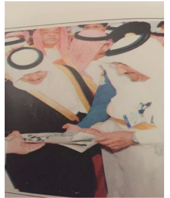
مع الأمير في عرافات ١٤٢٧هـ

انضمت البلاد اليوم للتكليم ٢٩ رجب - ١٦ يونيه بهذه المناسبة والتي نشرت امير الصحف الاول الثناء ورح صاحب السمو الملكي الامير نايف بن عبد العزيز رحمه الله - الاحد ٢٧ رجب - ١٧ يونيه انشاء دهن الأمير