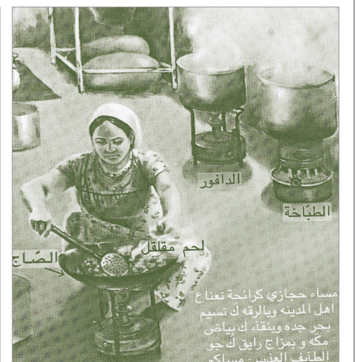
مساء حجازي كرائحة تعناح أهل المدينة وبالرقة ك نسيم بحر جده وينقاء ك بياض مكة وبمزاج رايق ك جو الطيف العذب - مسابك من بنكهة أهل الغربية