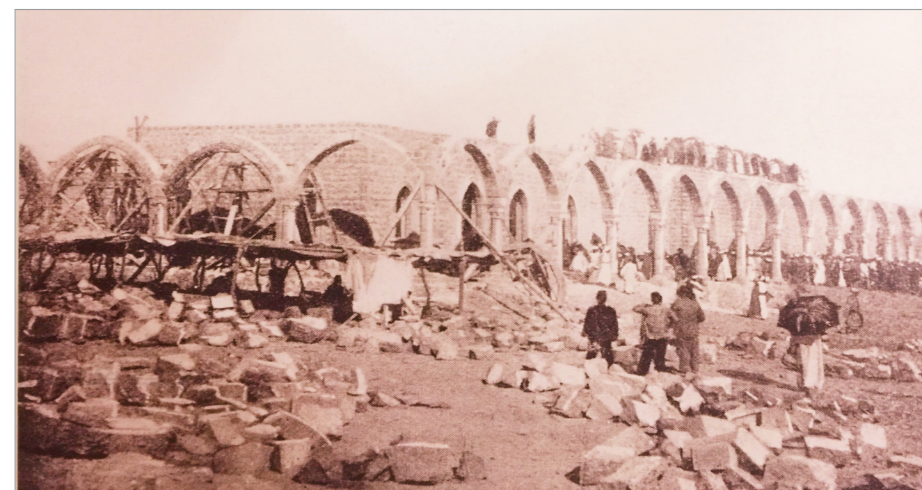
صورة أثناء بناء محطة الاستسيون بالعنبرية ويظهر في الصورة حجارة البناء الذي في أواخر عهد السلطان عبد الحميد الثاني