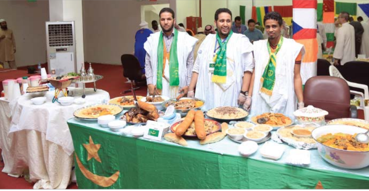
المدينة المنورة - جازي الشريف

ضمن فعاليات مهرجان الثقافات والشعوب والذي تنظمه عمادة شؤون الطلاب في الجامعة الإسلامية في المدينة المنورة أقيمت العديد من الفعاليات والأنشطة المختلفة حيث عرض المشاركون في المهرجان في اجنحتهم الآكلات الشعبية في بلدانهم ، وقد شارك أكثر من ٦٠ جناحاً في هذه الفعالية . كماعرضت كذلك أبرز العادات والتقاليد والموروث الشعبي للدول المشاركة كما أقيم مسرح للطفل حيث تفاعل الأطفال مع العروض المسرحية .