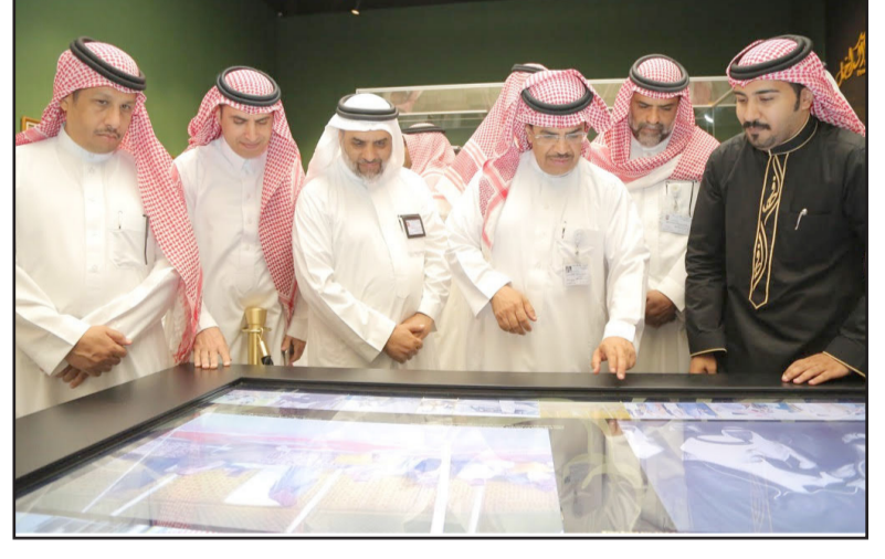
المدرسة معرض الفهد روح القيادة جسد شخصية بانورامية قيادية

وأشار الدكتور المديرس إلى أن طلاب وطالبات المنطقة الشرقية استلهموا الروح القيادية للملك القائد الراحل ، واكتسبوا مهارات القيادة وطريقة التعامل مع الأحداث ، أيما كان حجمها ، وذلك من خلال زيارتهم الجيدة يومياً للمعرض بالتنسيق مع اللجنة المنظمة ، وأيضاً من خلال الدورات التدريبية والفعاليات المصاحبة ، حيث حظي المعرض منذ افتتاحه بزيارة ما لا يقل عن عشرة آلاف طالب وطالبة ، من أكثر من ٢٠٠ مدرسة للبنين والبنات بالمنطقة الشرقية .