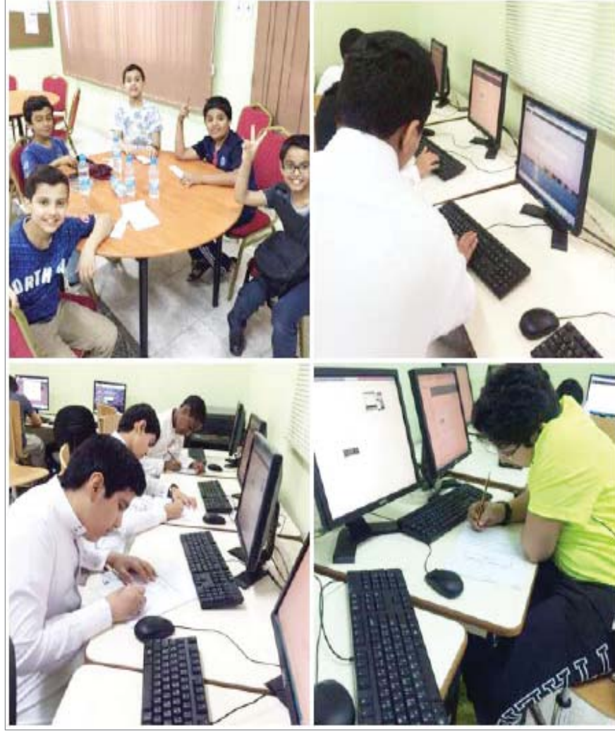
الرياض - البلاد

انطلقت في إدارة الموهوبين بإدارة العامة للتعليم بمنطقة الرياض برامج الرعاية الإثرائية التتبعية المسائية خلال الفصل الدراسي الثاني للعام الحالي للطلاب الموهوبين والتي تستمر على مدى خمسة أسابيع بواقع ثلاث ساعات يوميا وذلك في مركز الرياض لرعاية الموهوبين