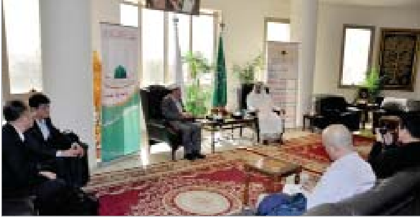
المدينة المنورة - جازي الشريف

عليه أفضل الصلاة والسلام، وذلك إنفاذا لتوجيهات معالي وزير الحج الدكتور بندر حجار الرامية لضرورة الاستعداد المبكر لموسم الحج وتسخير كافة الإمكانيات لراحة الحجاج الكرام في ظل دعم حكومة خادم الحرمين الشريفين الملك سلمان بن عبدالعزيز - وسمو ولي عهده الأمين - حفظهم الله - وأضاف أن المؤسسة بفضل الله أولا وأخيرا استطاعت خلال موسم حج ١٤٣٦هـ النجاح في تقديم خدماتها لقرابة مليون وثلاثمائة ألف حاجا من خلال (١.٤٦١.٨٨٨) ساعة عمل نفذها العاملون بالمؤسسة، وهو انجاز يستوجب الحمد لله تعالى ومضاعفة الجهد لمواصلة النجاح وتطوير الخدمة المقدمة لضيوف الرحمن بالمدينة المنورة بمتابعة وتوجيه صاحب السمو الملكي الأمير فيصل بن سلمان أمير منطقة المدينة المنورة رئيس لجنة الحج بالمدينة.