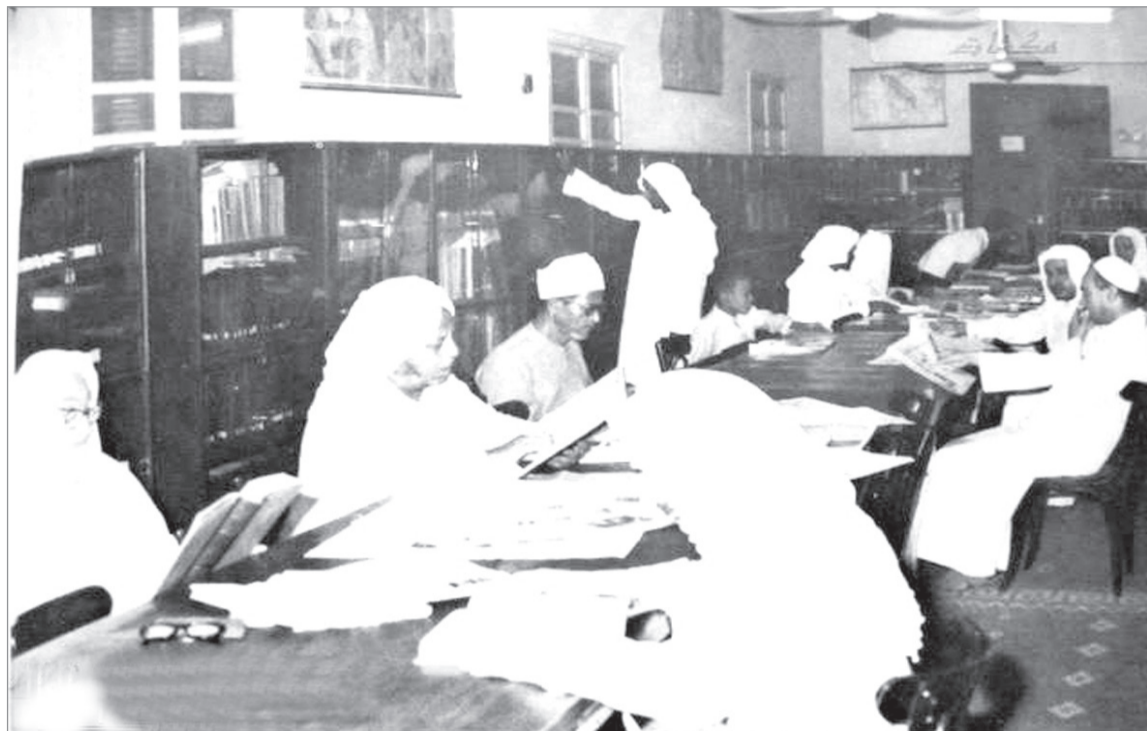
حالة نصار - الرياض

هذه المواد نشرت بتاريخ ٦ / ١٠ / ١٣٨٤ هـ الموافق ٨ / ٢ / ١٩٦٥ م