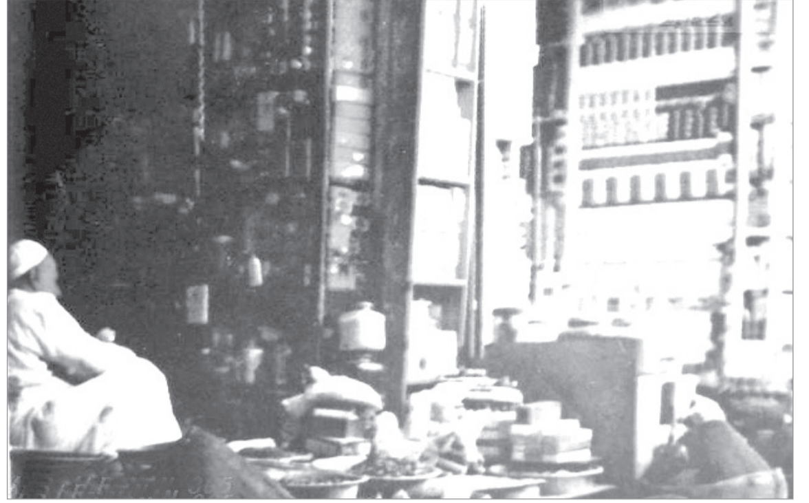
التجهيز للطبخ أثناء رحلة برية

هذه المواد نشرت بتاريخ ١٩ / ٢ / ١٣٨٥ هـ الموافق ١٨ / ٦ / ١٩٦٥ م