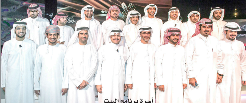
أسرة برنامج البيت