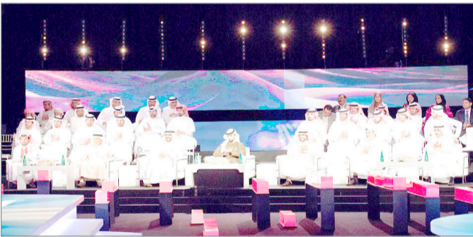
الحضور وأسرة البرنامج