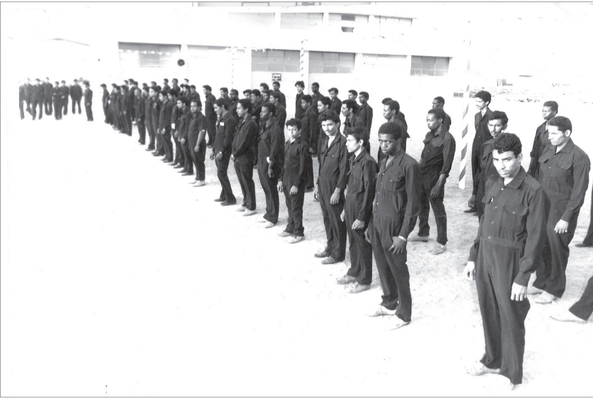
طلاب معهد التدريب المهني بجدة