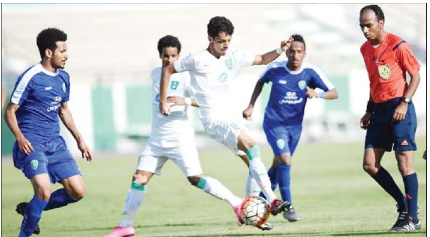
جدة- عبد العزيز عركوك

أقيمت يوم أمس الأول خمس مباريات ضمن مباريات الجولة الثاني عشر من الدوري السعودي الممتاز لدرجة الشباب وجاءت نتائجها كالتالي فوز الأهلي على الفتح بهدفين لواحد وخسارة الاتحاد من الاتفاق بهدف وحيد وتغلب النصر على العدالة بهدفين نظيفين فيما حقق الهلال انتصارا كبيرا على العربي بعشرة أهداف دون رد وتمكن الشباب من كسب هجر بهدف دون مقابل. وجاء الترتيب على النحو التالي النصر أولا ب٤ نقطة والهلال ثانيا ب٤ نقطة والأهلي ثالثا ب٣ نقطة والشباب رابعا ب٢٨ نقطة والفتح خامسا ب٢٥ نقطة والاتحاد سادسا ب٢٤ نقطة والراند سابعا ب٢١ نقطة وهجر ثامنا ب٢١ نقطة والاتفاق تاسعا ب١٥ نقطة والعدالة عاشرا ب١٣ نقطة والقاسمية في المركز الحادي عشر ب١٢ نقطة والعربي أخيرا ب٨ نقاط.