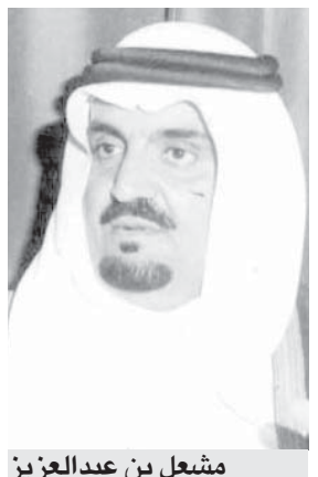
مشعل بن عبدالعزيز

وقد اتصل بنا سيادة مدير مكتب امارة منطقة مكة المكرمة حيث اكد لنا باسم حضرة صاحب السمو الملكي الامير مشعل بن عبدالعزيز بان المجلس لم يحل وانما انتهت دورته الانتخابية ليجري الرجوع مرة اخرى الى الناخبين في اختيار من يمثلهم في الدورة القادمة.