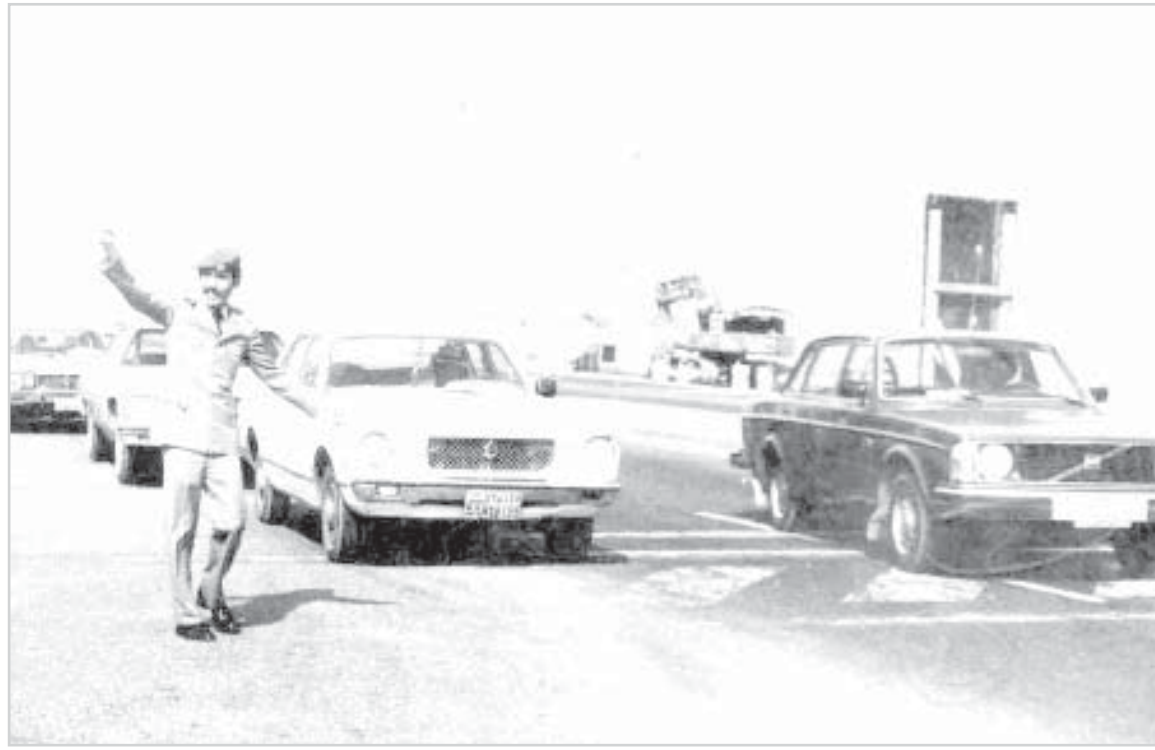
تنظيم حركة المرور