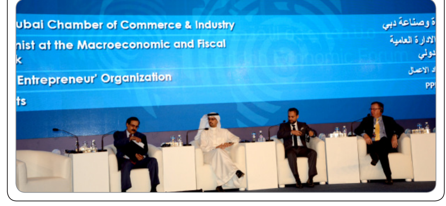
المنتدى الاقتصادي بجدة ٢٠١٦

ويبحث المنتدى أفضل السبل الكفيلة بتحقيق الشركات الناجحة بين القطاعين العام والخاص لتنويع الاقتصاد الوطني. وأكدت غرفة جدة اكتمال كافة استعداداتها لإقامة هذا الحدث العالمي بالشراكة الاستراتيجية مع وزارة الاقتصاد والتخطيط وشراكة التنويع مع وزارة التجارة والصناعة، في ظل ارتفاع عدد المتحدثين إلى ٨٢ شخصية محلية وعالمية والريادة إلى ٢٦ شركة مؤسسية وطنية، في حين تمثل الوفود الزائرة أكثر من ٤٠ دولة.