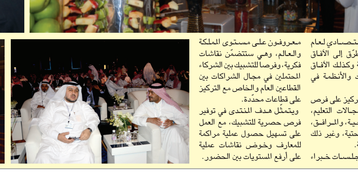
المنتدى الاقتصادي بجدة ٢٠١٦

ويبحث المنتدى أفضل السبل الكفيلة بتحقيق الشركات الناجحة بين القطاعين العام والخاص لتنويع الاقتصاد الوطني. وأكدت غرفة جدة اكتمال كافة استعداداتها لإقامة هذا الحدث العالمي بالشراكة الاستراتيجية مع وزارة الاقتصاد والتخطيط وشراكة التنويع مع وزارة التجارة والصناعة، في ظل ارتفاع عدد المتحدثين إلى ٨٢ شخصية محلية وعالمية والريادة إلى ٢٦ شركة مؤسسية وطنية، في حين تمثل الوفود الزائرة أكثر من ٤٠ دولة.