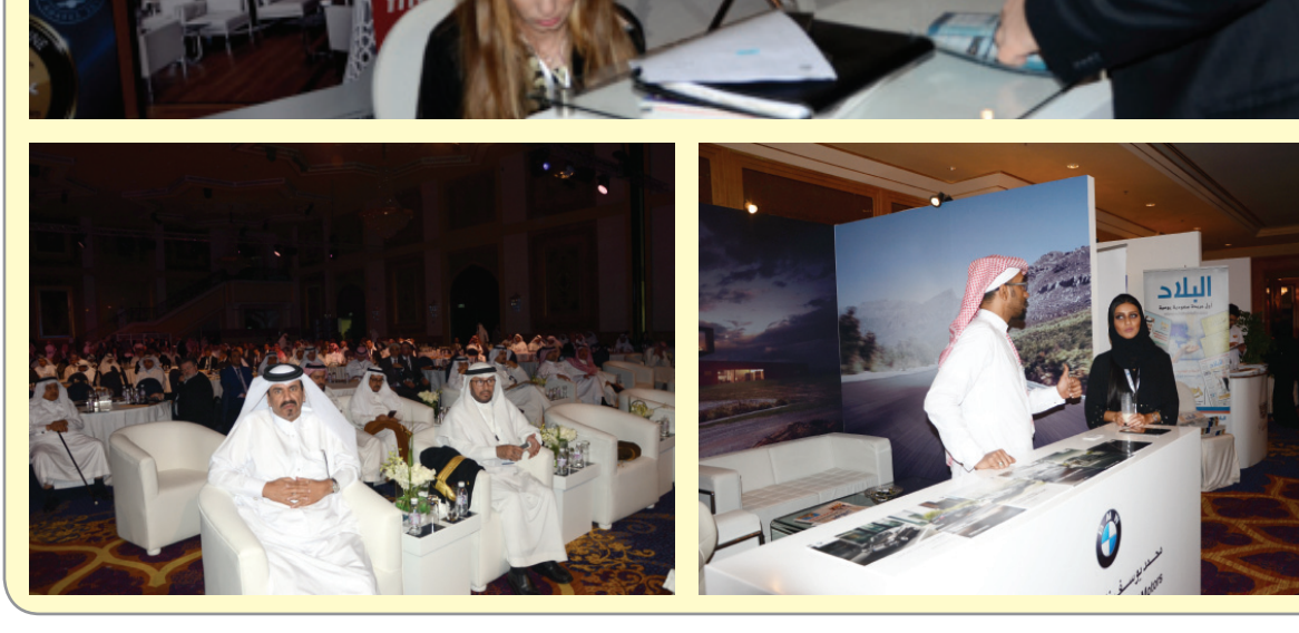
المنتدى الاقتصادي بجدة ٢٠١٦

ويبحث المنتدى أفضل السبل الكفيلة بتحقيق الشركات الناجحة بين القطاعين العام والخاص لتنويع الاقتصاد الوطني. وأكدت غرفة جدة اكتمال كافة استعداداتها لإقامة هذا الحدث العالمي بالشراكة الاستراتيجية مع وزارة الاقتصاد والتخطيط وشراكة التنويع مع وزارة التجارة والصناعة، في ظل ارتفاع عدد المتحدثين إلى ٨٢ شخصية محلية وعالمية والريادة إلى ٢٦ شركة مؤسسية وطنية، في حين تمثل الوفود الزائرة أكثر من ٤٠ دولة.