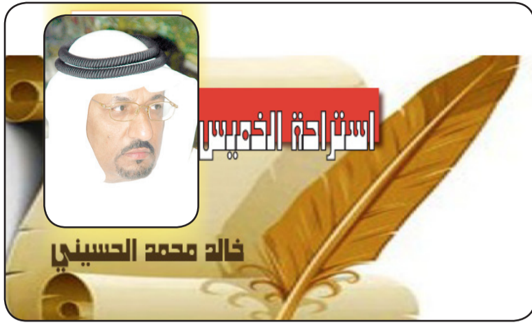
خالد محمد الحسيني

تولى بعد عودته للمملكة عدة مناصب مهمة جعلته المسؤول الاول عن شؤون النفط فقد عين اولاً في وزارة المالية المسؤولة عن شؤون البترول في حينه مديراً عاماً مكتب التفتيش على الشركات البترولية في المنطقة الشرقية في ١٩٤٩م ثم مديراً عاماً لادارة شؤون الزيت والمعادن ١٩٥٤م ثم في ١٩٥٩م اصبح هو والسيد حافظ وهبة اول عضوين سعوديين في مجلس ادارة شركة ارامكو وممثلين للحكومة السعودية.. اصبح ما بين ٢١ ديسمبر ١٩٦٠م وحتى حالته للتقاعد ١٩٦٢م وزيراً للبترول والثروة المعدنية وهول اول وزير بترول في المملكة.