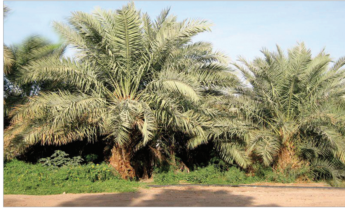
المتخصصة والمعروفة لدى أهلها ويتخلل تلك الاسواق بعض المقاهي التي تخدم على أهل السوق في عملية تناغم جميل. انه ذلك الزمان الذي مضى كما يمضي العمر في غفلة من الانسان.

تمدت فذهب ذلك العبق الجميل الذي كان يزين ليالينا الشتاتية.. ويطبع نهارها الدافئ.. بتلك السكنية التي كانت تظلل طرقاتها.. فلا تكاد تسمع لواقع خطوات اهلها وهم ذاهبون الى مسجدها العظيم أي صدى.. غير صوت تساقط حبات "مسابحهم" بين اصابعهم. •• لخذنا الحوار ونحن على تلك الربوة وامامنا "بقايا" من بساتين العوالي وقربان.. الاسمنتية لخذنا الى زمن مضى.. وعمر طويل.. عاشته هذه البساتين بصوت "بكرات السواني" "الحزين وذلك النغم الحالم الذي يطلقه ذلك "الفلاح" وهو يتحرك مع غرب الماء "صعودا وهبوطا في تلك البئر الحجرية العميقة. وتمايل رؤوس النخيل.. مع "هبوب" النسيم فتشعر انك تميل معه.. حيث مال وكان "خوصه" وجريدة "جدائل" فانتة حتى قال شاعرنا "حسن صيرفي" رحمه الله: شوف النخل كيف مايس في "الجزع" كأنه عرايس غطي بشعره الجنية خلا الجنية خميلة