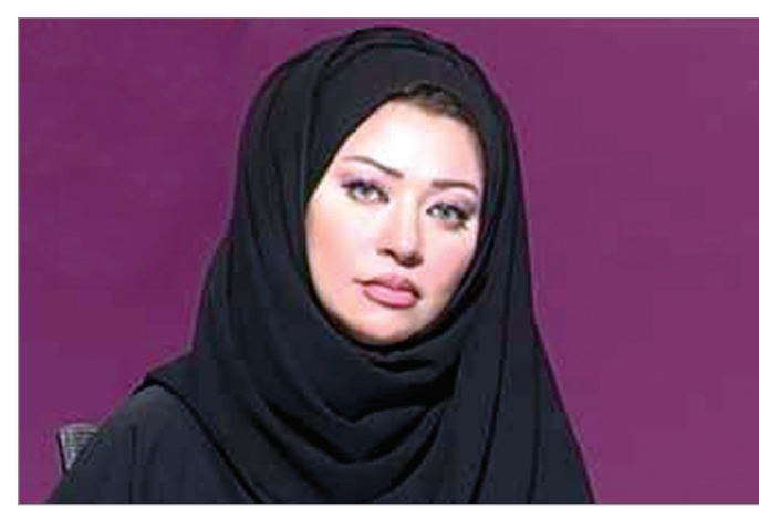
الإعلامية عبير الماحي

التي تعود عليها المشاهد في البرامج الاقتصادية بأسلوب عقلاني متزن وهي محطة في مسيرتها الملتزمة بالمصداقية واحترام الذات.