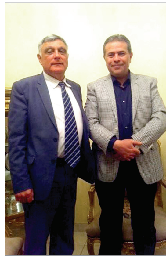
عوكش مع السفير الاسرائيلي في منزله

عليها كشفت مصادر مؤكدة ان الشهادة التي قدمها للمجلس ماهي الا شهادة من معهد للتدليك في الولايات المتحدة ولازال من الدعاية للشراء من معرضه.. عوكش يريد القاء خطاب في الكنيست الاسرائيلي (واللي يعيش ياما يشوف).