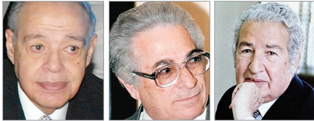
إحسان عبدالقدوس أنيس منصور إبراهيم سعده

في أواخر عام ١٩٧٤م اختراني الأستاذ الراحل علي أمين لكي أكون سكرتير لجله (آخر لحظة) التي أراد إعادة إصدارها بعد أن توقفت منذ عام ١٩٦٥م.. وكان الأستاذ علي أمين وتوأمه مصطفى أمين يريدان الأسراع بأصدار المجلة الشبابية التي تخاطب شريحة الشباب تحت العشرين.. فيما اختير الأستاذ إبراهيم سعده رئيساً لتحريرها ورشح الأستاذة الراحلة حُسن شاه ككاتبة له. وكنت أذهب يومياً للأستاذ علي أمين بمستشفى العجوزة لعرض البروفات عليه مما أنتجناه مع فريق العمل.. ولعطيني توجيهاته التي كانت بمثابة دروس خصوصية في بلاط صاحبة الجلالة.. وفي ليلة انتهينا فيها مبكراً من العمل جلست مع الأستاذ علي أمين أسأله عن الأستاذ هيكل وتاريخه والأستاذ أنيس منصور وعلاقتهم بالأستاذ إحسان عبدالقدوس.. وروى لي ما تصديق به مساحة النشر هنا عن شخصيته وبداياته وكيف وصل كل منهم ليكون نجماً لامعاً في عالم الصحافة والأعمال.. والأستاذ محمد حسنين هيكل كانت حياته قصة رائعة فيها جوانب إيجابية رائعة وجوانب سلبية وإن كنت معه أو اختلفت معه هو شخصية ذكية استطاعت أن تكون مثيرة للجدل.. لدرجة أن فيلمًا أنتج بالسينما الميلاودية تحت مسمى