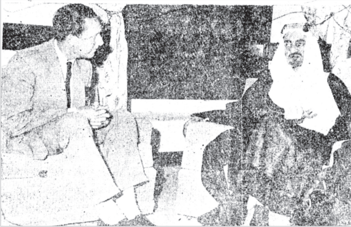
صاحب السمو الأمير فيصل أثناء استقباله للصحفي البريطاني مايكل ويب مراسل جريدة (ديلي اكسبريس) بقصر شبرا