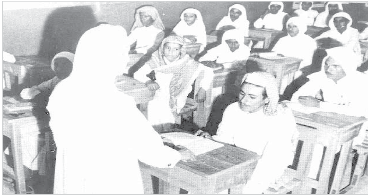
حصة داخل احدى الفصول الدراسية - الرياض