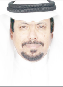
محمد بن حامد الجديدي

تعيش الأمة الإسلامية حالة من الترقب، أمام معطيات فرضتها الظروف الراهنة، كانت بحاجة لصناعة قرارات حاسمة، وإلى مبادرات في الدعوة مع الأمم الأخرى، في المجالات الثقافية والاجتماعية التي تبتثق من مناهجها الإسلامية، وفيها الدينية وثوابتها التاريخية، هذه الأمة التي لا تعرف للعداء طريقاً، امتثالاً لمبادئ الإسلام الرفيعة وقيمته الأخلاقية، يقودها صفوة أهل الفضل من العلماء والمفكرين، في زمن الاعتدال والوسطية ووضوح الرؤية، ولعل هذه المؤشرات الإيجابية تقودنا لذكر بعض الجهود المثمرة، ممثلة في معالي الشيخ الدكتور عبدالله بن عبدالمحسن التركي، أمين عام رابطة العالم الإسلامي، رئيس رابطة الجامعات الإسلامية.