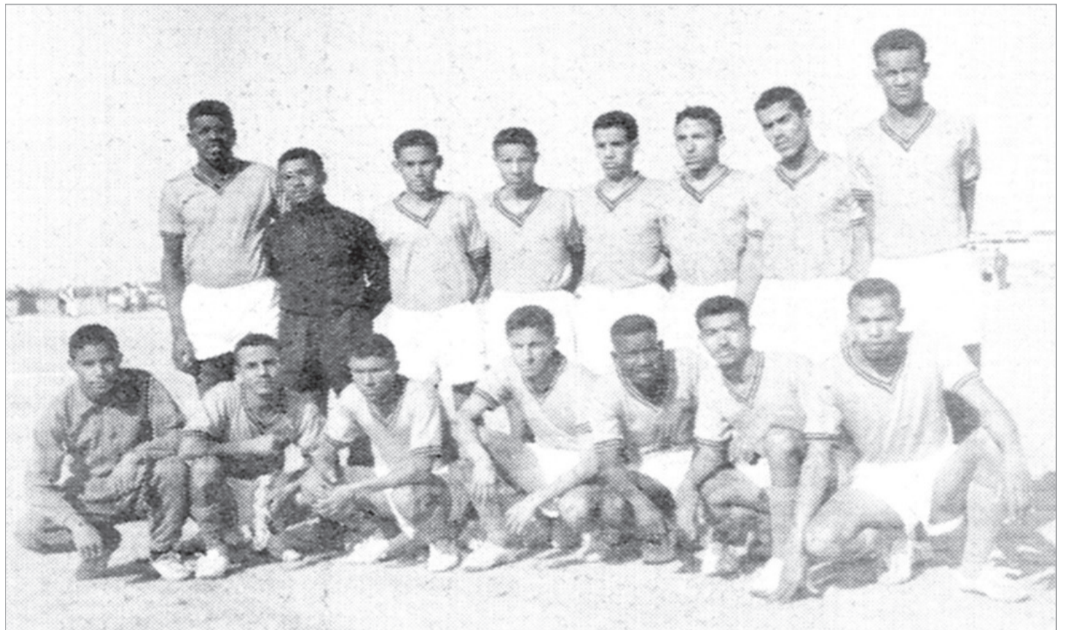
في مباراة يوم الجمعة الماضي فاز فريق النجمة ببطولة المنطقة الوسطى لكأس المناطق العام الماضي ١٣٨٤ هـ