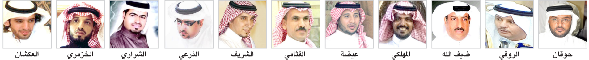
حوقان، الروقي، ضيف الله، المهلكي، عيضا، القتامي، الشريف، الذرعي، الشراري، الخزمري، العكشان

نسعد باستقبال اتصالاتكم ومشاركاتكم الشعرية من خلال الإيميل hilael@albiladdaily.com أو الفاكس ٠١٢ ٦٧٢٠٠٦٢ أو الهاتف ٠١٢ ٦٧١١٠٠٠ تحويلة ٢٠٠ ويا هلا بكم