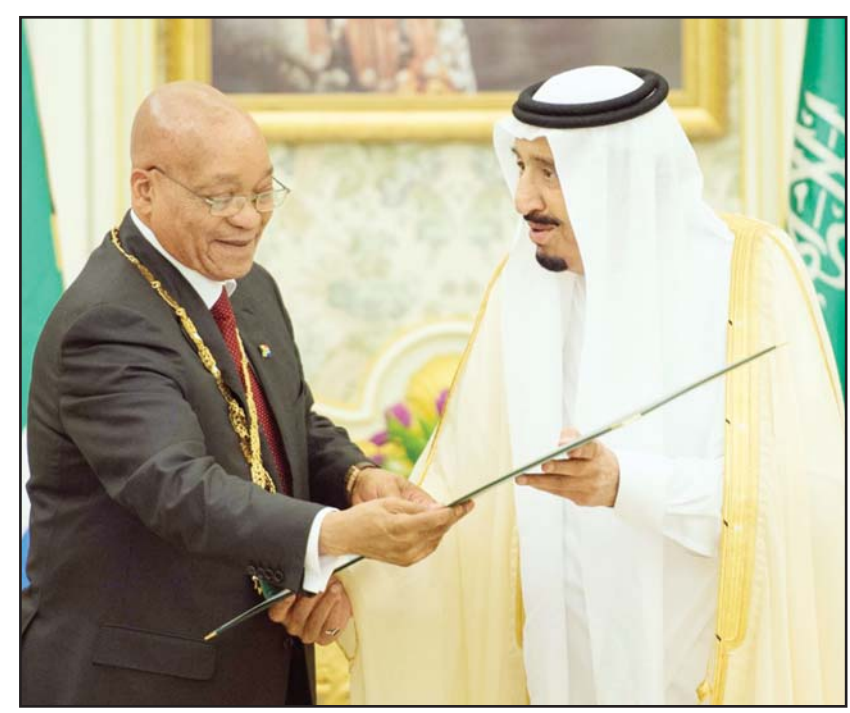
خادم الحرمين خلال لقائه ومباحثاته مع رئيس جنوب أفريقيا