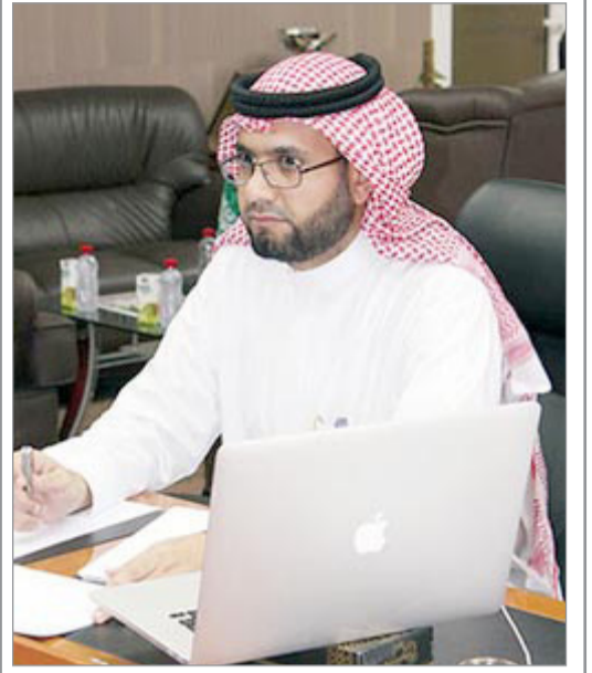
المدينة المنورة - جازي الشريف