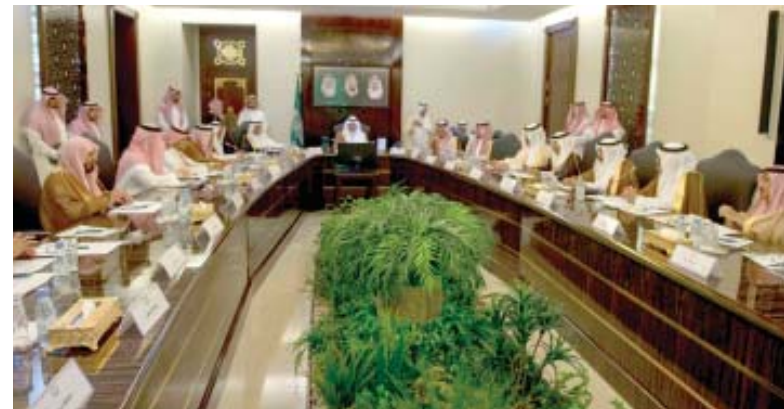
جدة - عبد الهادي المالكي أكد مستشار خادم الحرمين الشريفين ، أمير منطقة مكة المكرمة ، صاحب السمو الملكي الأمير خالد الفيصل أهمية أن يضطلع المحافظون بدورهم التمثيل في لقاء المواطنين وتلمس حاجاتهم وحل مشاكلهم ، سيما وأن دور المحافظة ليس تقليديا بل يشمل متابعة التنمية والشمارع على صعيدي بناء الإنسان وتنمية المكان.

جدة - عبد الهادي المالكي خلال الاجتماع الأول الذي عقد في الإمارة بجدة أمس (الثلاثاء) برئاسة أمير منطقة مكة المكرمة وحضور محافظي المنطقة ، أكد الأمير خالد الفيصل على أهمية خدمة سكان المحافظات ومتابعة المشاريع وتحسين الخدمات المقدمة لهم