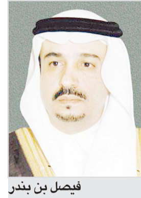
فيصل بن بندر

الرياض الدولي للمعارض والمؤتمرات محاضرات ورش عمل علمية وتدريبية في الفترة المسائية، كما تم تخصيص الفترات الصباحية لزيارة طلاب المدارس للمعرض ويقام على هامش الملتقى حفل توزيع جوائز التميز السياحي، وهو الحفل الذي تنتظره المنشآت السياحية والأشخاص الفائزين بجوائز التميز في المملكة لهذا العام. وأوضح نائب رئيس الهيئة للتسويق والبرامج ورئيس اللجنة المنظمة للملتقى حمد آل الشيخ أن الجهود والاستعدادات مستمرة لإطلاق الدورة التاسعة من ملتقى السفر والاستثمار السياحي، موضحة أن الملتقى يهدف إلى تمكين أصحاب الأعمال السعودية والسياحية والشركاء الأساسيين من التعاون والتنسيق لتكوين سياحة حديثة ومرنة ومتكاملة وقيمة ومراعية للبيئة والقيم والتقاليد الأصيلة، إضافة إلى دعم وتحفيز الاستثمار السياحي في