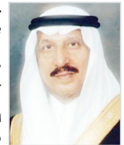
محمد بن ناصر

وبين وكيل إمارة منطقة جازان المساعد للشؤون التنموية أمين مجلس المنطقة أحمد بن عبدالله زعلة، أن سمو أمير المنطقة سيفتتح الجلسة بكلمة توجيهية، ويناقش مع أعضاء المجلس جملة من الموضوعات ومحاضر اللجان والتقارير المنبثقة عن المجلس وغيرها من الموضوعات المدرجة على جدول الأعمال. وأختتم تصريحه مفيداً أن الجلسة الثانية من جلسات المجلس ستعقد بعد غد الاثنين، بحضور عدد من أعضاء مجلس الشورى وذلك بقاعة الاجتماعات في الإدارة العامة للتعليم بجازان، ويحث العديد من الموضوعات المدرجة على جدول أعمال الجلسة، وأن المجلس سيواصل عقد جلساته طيلة أيام الأسبوع الحالي.