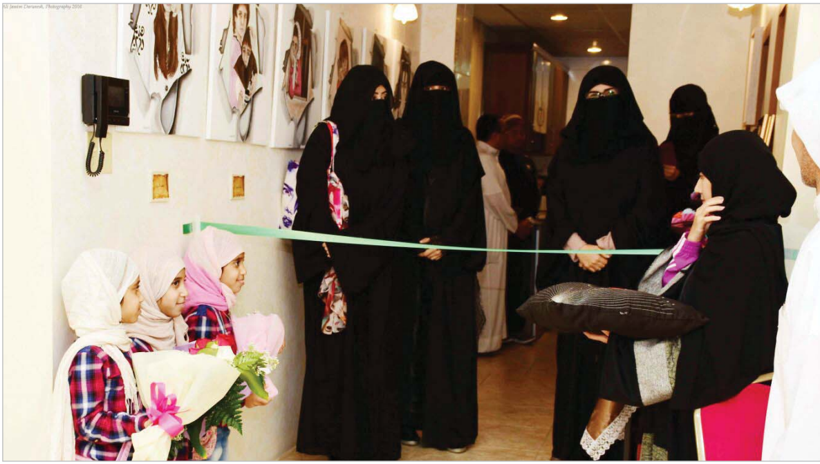
القطيف - البلاد