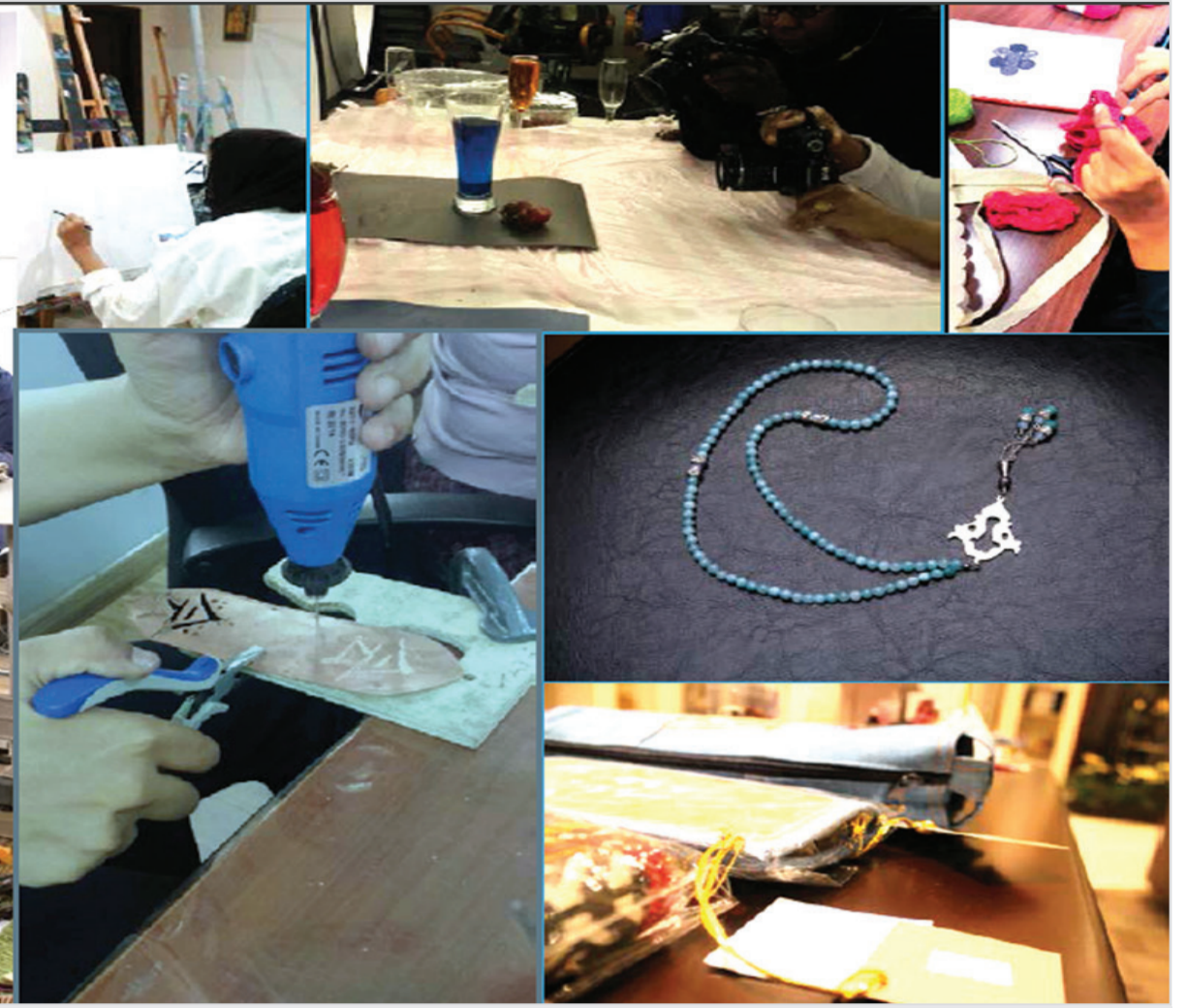
تدريب متواصل مع توفر جميع الإمكانيات