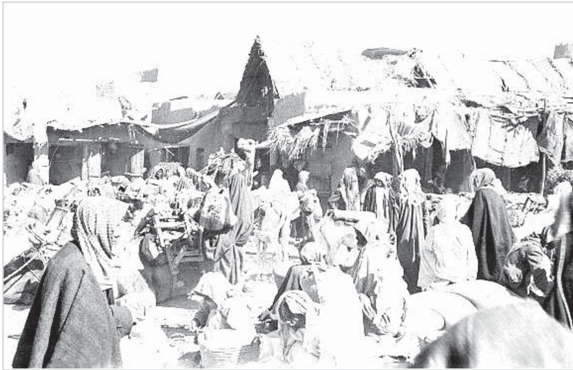
سوق المقيبرة - الرياض