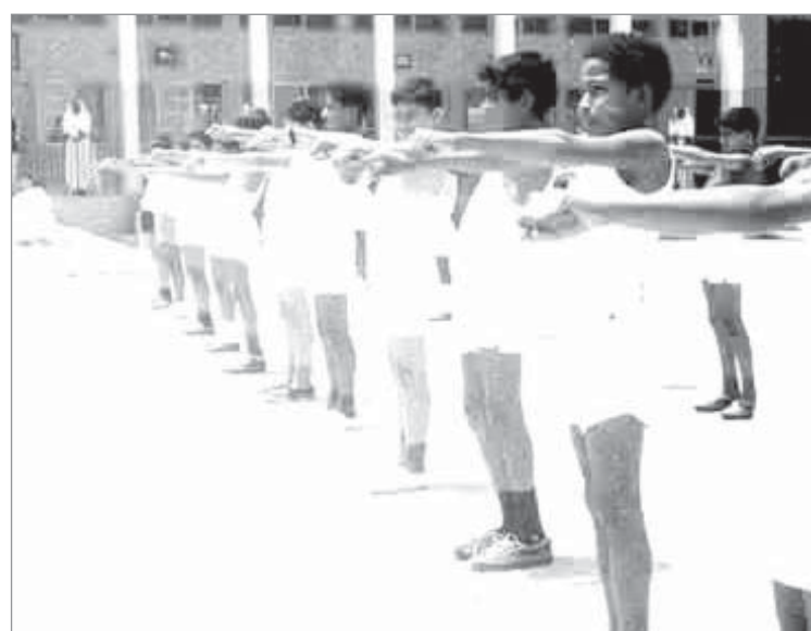
حصة التربية الرياضية