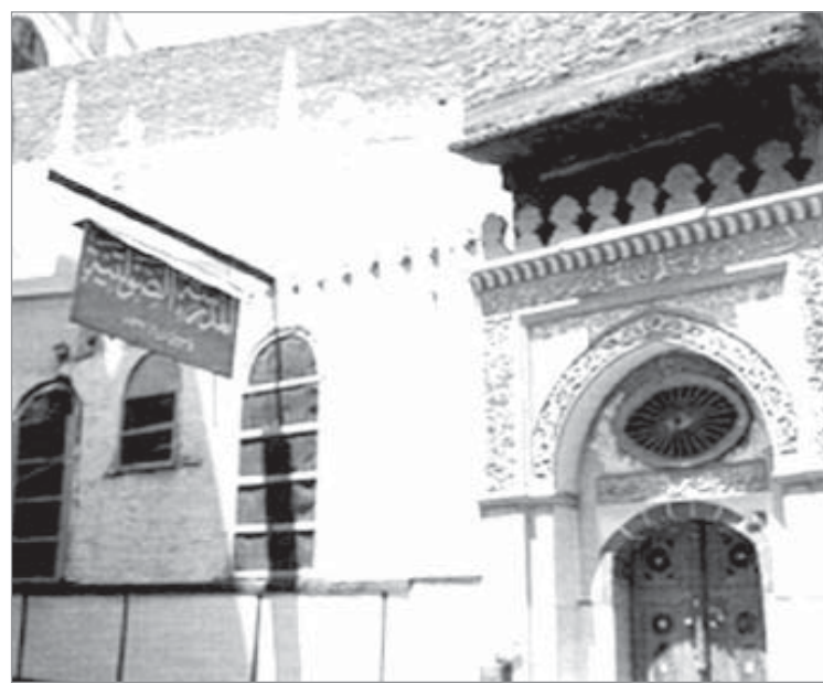
المدرسة الصولتية إحدى أقدم المدارس بالملكة العربية السعودية