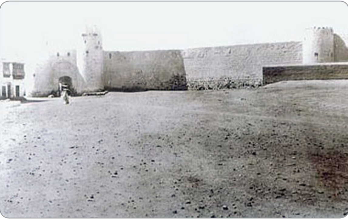
الباب الشامي ، لسور المدينة عام ١٩٣١ م