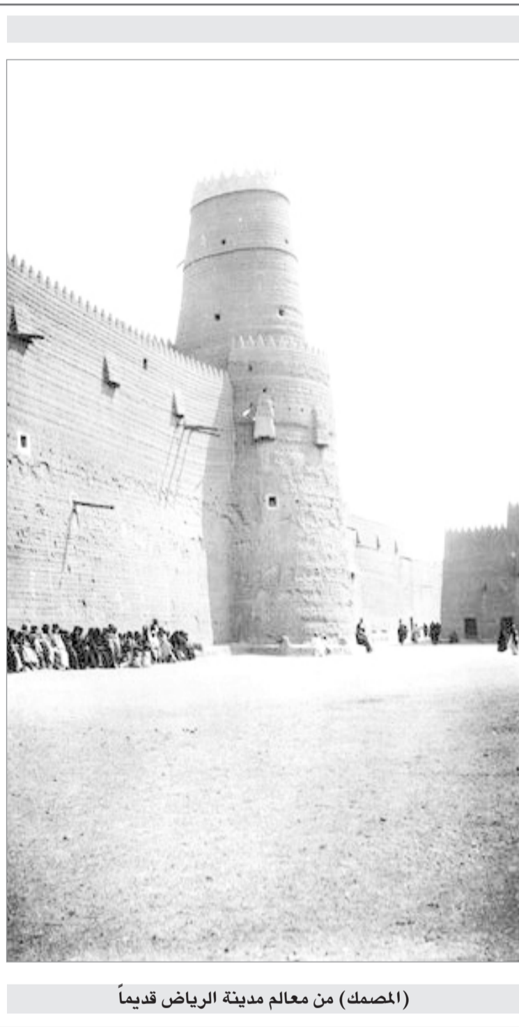
(المصمك) من معالم مدينة الرياض قديماً

كرة من صبارا الى ادوري بعد ٢٥ دقيقة مسجلا لاهداف الرابع وانتهى معه الشوط.