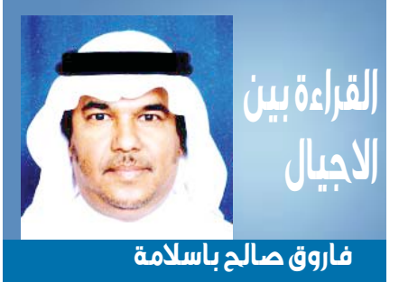
القراءة بين الأجيال