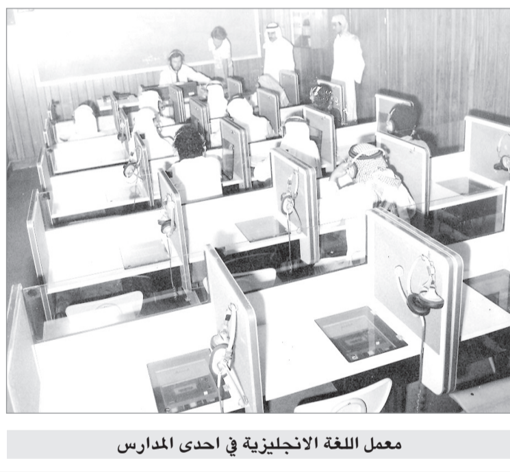
معمل اللغة الانجليزية في احدى المدارس