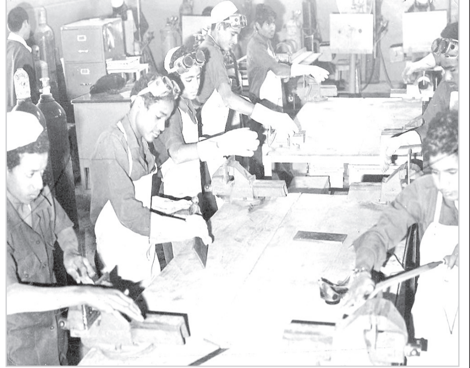
معهد تدريب مهني

هذه المواد نشرت بتاريخ 25 - 1 - 1385 هـ. 26 / 5 / 1965 م