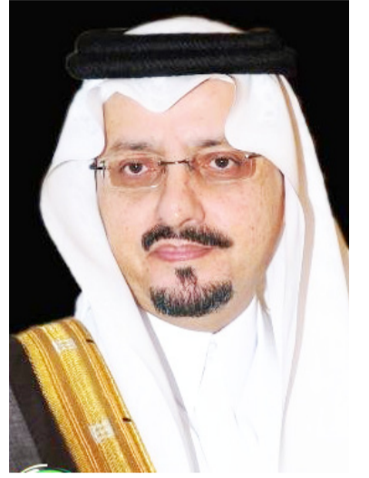
الأمير فيصل بن خالد