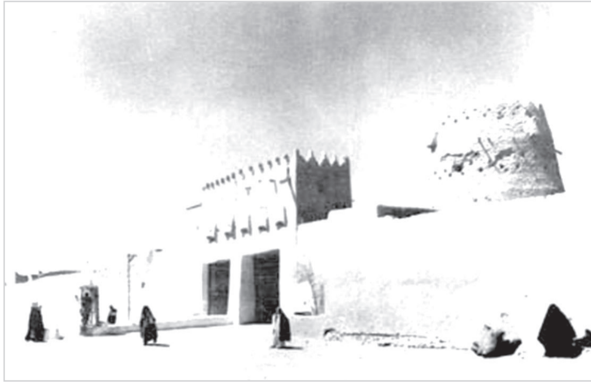
بوابة الثميري بعد توسعتها في عهد الملك عبدالعزيز