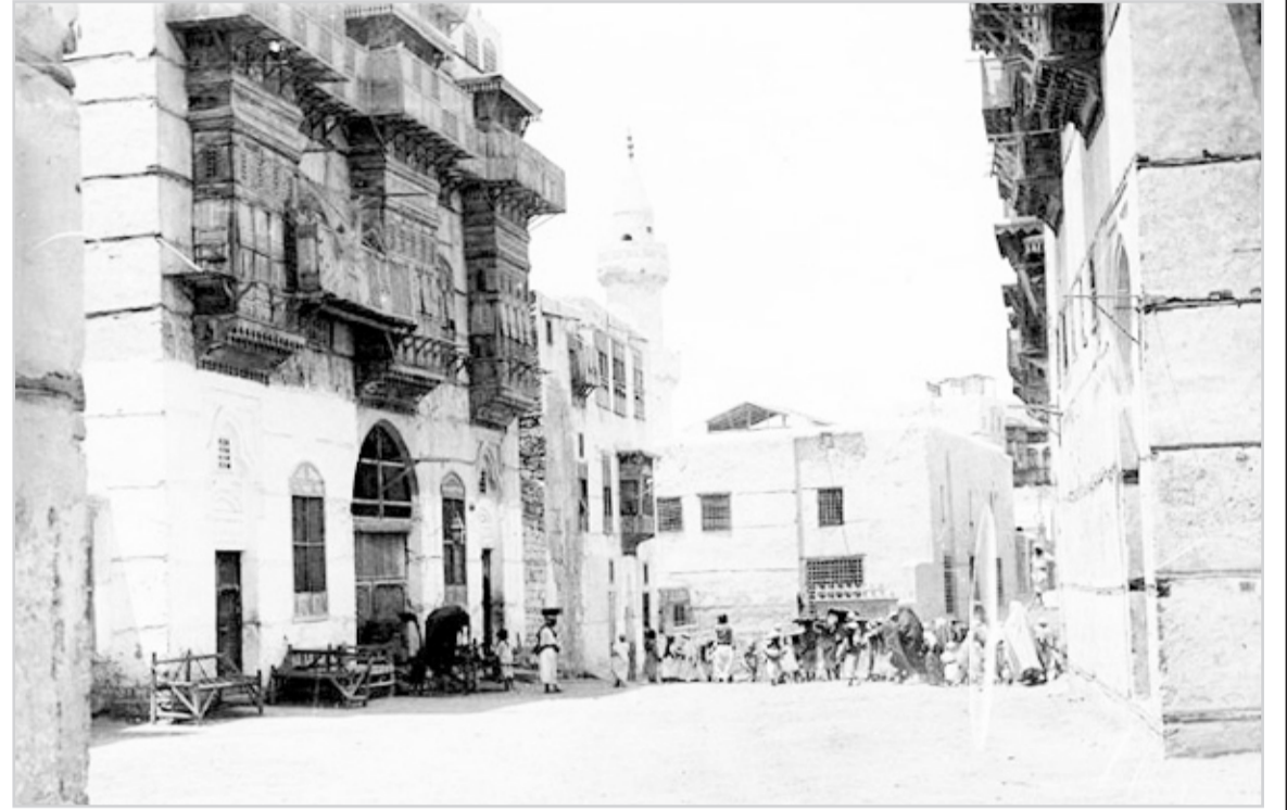
مدينة جدة - السبعينيات الميلادية

هذه المواد نشرت بتاريخ 14 - 2 - 1385هـ الموافق 13 / 6 / 1965م