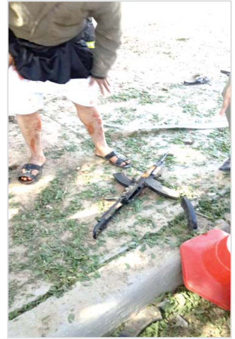
الإرهابي الذي قبض عليه المصلين قبل أن يفجر نفسه