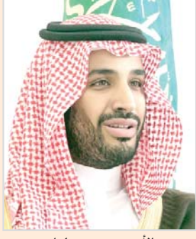
الأمير محمد بن سلمان

ومعالي الدكتور خالد بن محمد العطية وزير الدولة لشؤون الدفاع بدولة قطر ، هنيئاً بمنصيبهما الجديدين متمنياً لهما التوفيق . فيما عبر كل من وزير الخارجية ، ووزير الدولة لشؤون الدفاع بدولة قطر ، عن شكرهما سمو ولي ولي العهد على تهنئته لهما سائلين الله التوفيق للجميع .