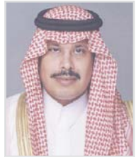
الأمير مشاري بن سعود

الرياض - البلاد تابع صاحب السمو الملكي الأمير مشاري بن سعود بن عبدالعزيز أمير منطقة الباحة، حادث انهيار الذي شهده أول أمس طريق عقبة حزنه بمحافظة بلجرشي والرابط بين قطاعي السراة وتهامة . وأفاد مدير عام العلاقات العامة والإعلام بإمارة الباحة خضر بن عبد الرحمن الغامدي، أنه منذ وقوع الحادث وجه سمو أمير المنطقة بإغلاق العقبة تماماً لحين إيجاد الحل الجذري لضمان سلامة مرتادي طريق العقبة وعدم تكرار مثل هذه الانهيارات ، لافتاً إلى أن سموه بحث مع وزير النقل آلية العمل على إيجاد الحلول الجذرية التي تكفل عدم تكرار مثل هذه الانهيارات.