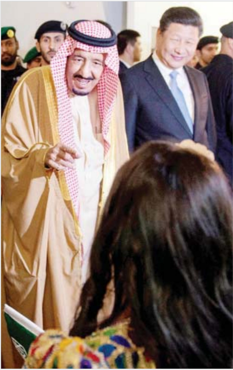
الملك سلمان والرئيس الصيني يدشنان مشروع (ياسرف)