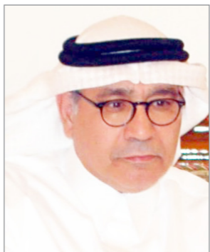
الدكتور فؤاد مصطفى عزب

بارك الله روحك يا بو غنوه.. بالأمس ابتعت آخر نص كتيبه قبل رحيلك..(الخواجه ياني) لازلت تأتي إلينا عبر المسافات وفسحة دخول الضوء كأنك شمس شديدة البياض .. كانت رائحة قبرك الزكية تقترب مني في كل كلمه وعبارة.. غار قلبي في الوجد ياسيدي تمنيت لو كنت أمامي لأخذك من ذراعك القوية ناحية صدري .. كنت أود أن أصعد إليك فوق سلالم اللهفة لأطول قامتك العالية وأشم رائحة الكون في جيبك .. تصر وأنت في بلاد اللا عودة أن تعود لتعشب بساتين إيامنا بكل ما فيها من اشواك .. جاءت الرواية كعكاز للقلب والانتظار ..