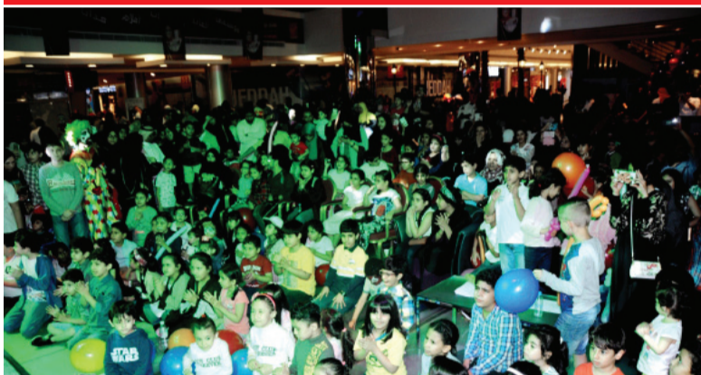
أطفال جدة حضروا حفل الافتتاح بكثافة