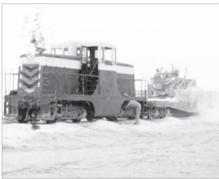
المرحلة الأولى لإنشاء السكة حديد الاربعينيات