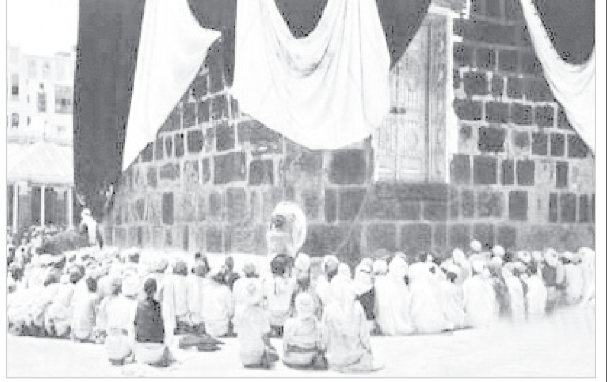
العبادة المشرفة وقت الصلاة

هذه المواد نشرت بتاريخ 7-1-1385هـ. 1965/5/8م