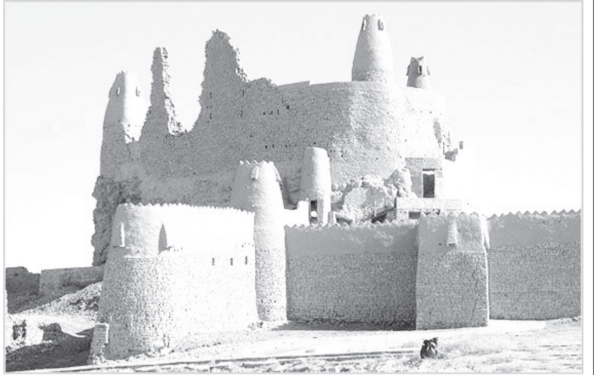
من آثار المملكة القديمة

هذه المواد نشرت بتاريخ 7-1-1385هـ. 8/5/1965م