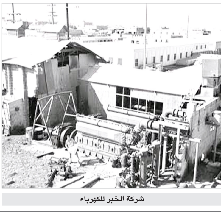
شركة الخبر للكهرباء