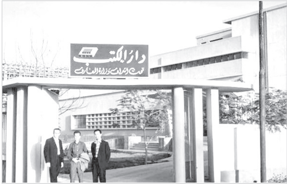
دار الكتب بالرياض ١٩٦٠م