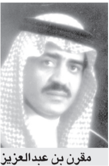
مقرن بن عبدالعزيز