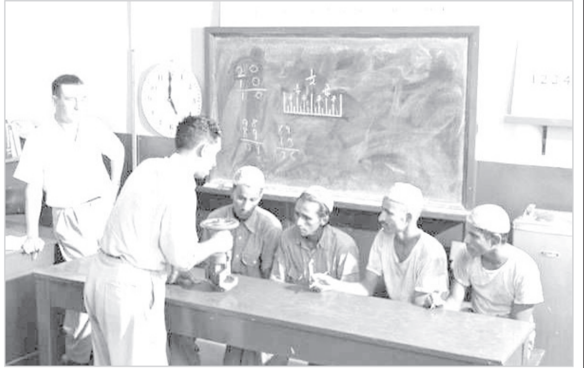
توجيه ناصر بن محمد لعدد من المتدربين في منتصف الخمسينيات

هذه المواد نشرت بتاريخ 18-1-1385هـ. 1965/5/19م