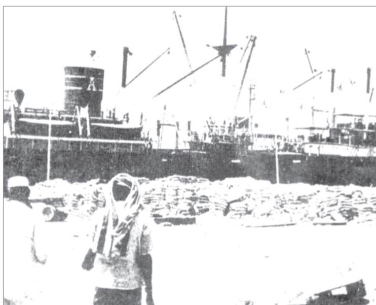
عملية تنزيل شحنات الأسمنت بالميناء