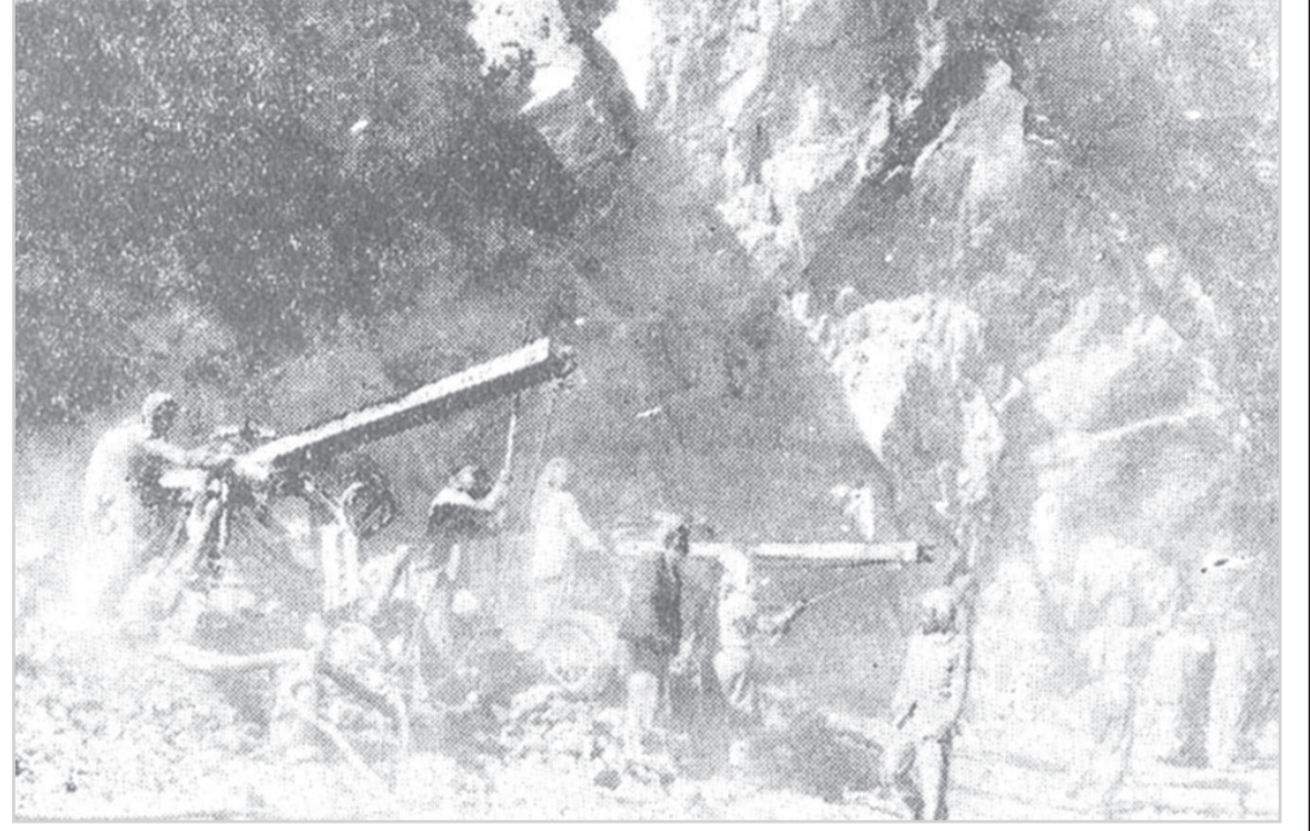
عمليات نسف الصخور بطريق الطائف الجديد

هذه المواد نشرت بتاريخ 16 - 1 - 1385 هـ. 17 / 5 / 1965 م