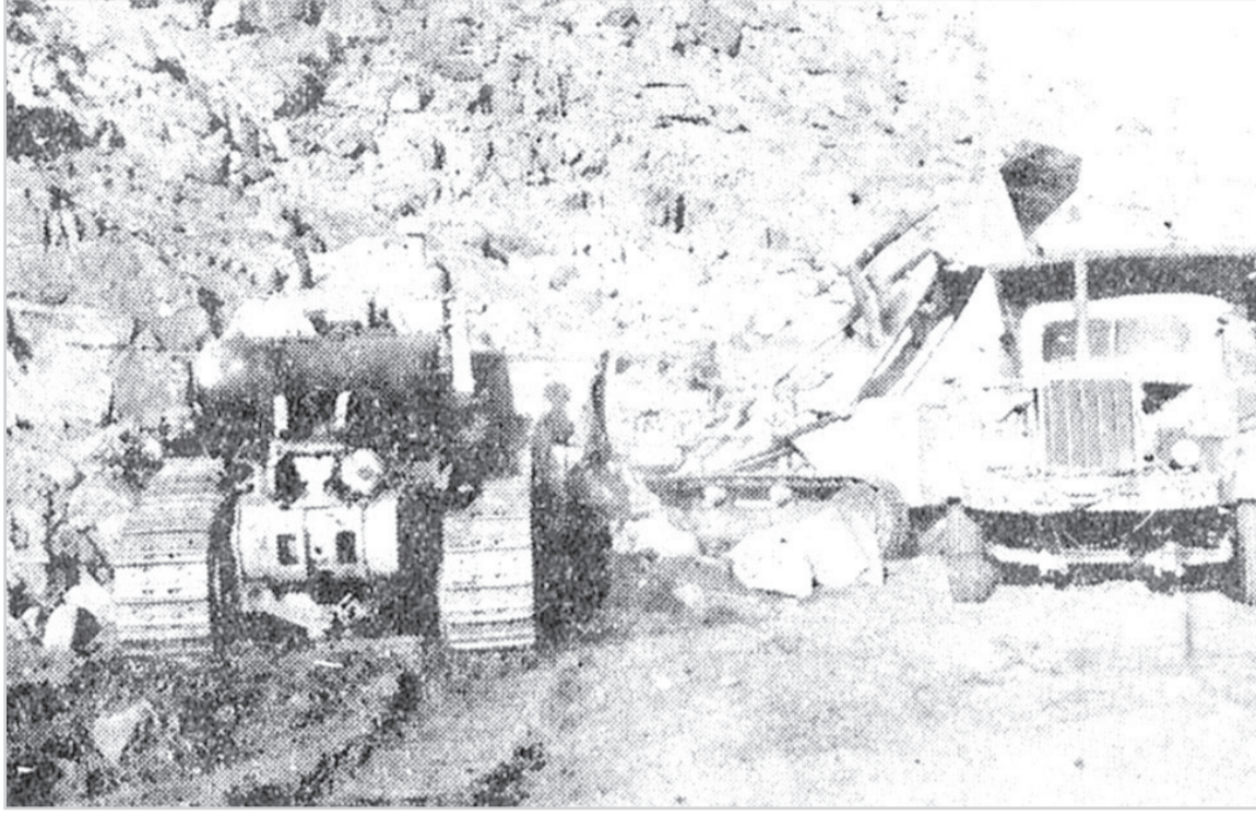
عمليات نقل الصخور بعد عملية نسفها بطريق الطائف الجديد