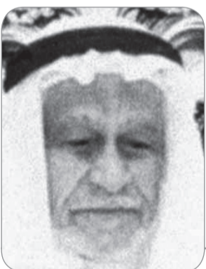
شعر: علي زين العابدين

هذه المواد نشرت بتاريخ 12/ 1/ 1385هـ الموافق 15/ 5/ 1965م