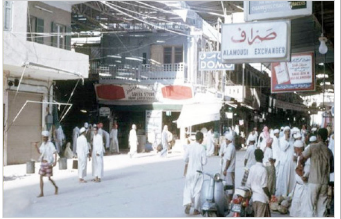
جدة سوق الندي

هذه المواد نشرت بتاريخ 14/1/1385 هـ الموافق 15/5/1965م