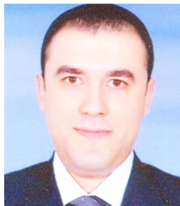
وهو جمهور إيديولوجي يؤمن بمواقفه، كنت أعارض مواقفه طوال الوقت، ولكنني احترمتها.