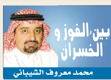
محمد معروف الشيباني

جدة - عبد الهادي المالكي يتفقد مستشار خادم الحرمين الشريفين أمير منطقة مكة المكرمة صاحب السمو الملكي الأمير خالد الفيصل اليوم الأربعاء محافظتي الكامل وخليص. وخلال الزيارة يلتقي أمير منطقة مكة المكرمة أعيان وأهالي المحافظتين ويستمع لمطالبهم، كما يرأس اجتماع المجلس البلدي بحضور أعضاء المجلس، ويدشن مشروعاً جديدة بالمحافظتين، ويطع أيضاً على المشروعات الجاري تنفيذها والتضمنة مشروعات صحية وتعليمية وبلدية وغيرها.