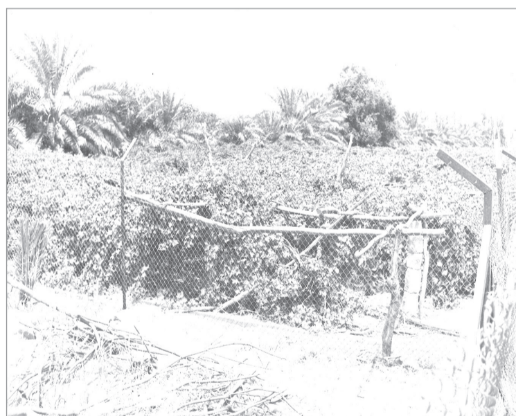
احدى المزارع حول المدن الكبيرة