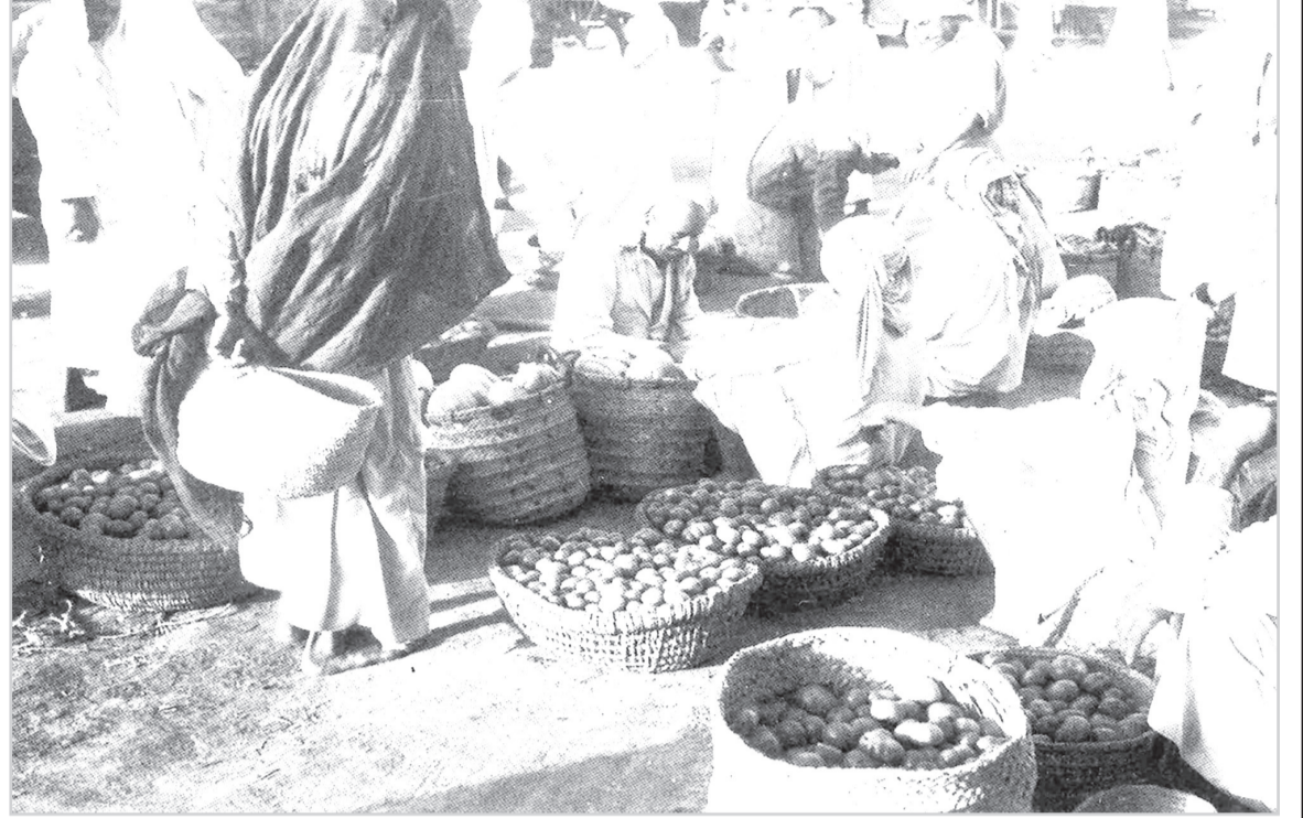
أحد الاسواق التجارية

هذه المواد نشرت بتاريخ 9 - 1 - 1385 هـ. 10 / 5 / 1965 م