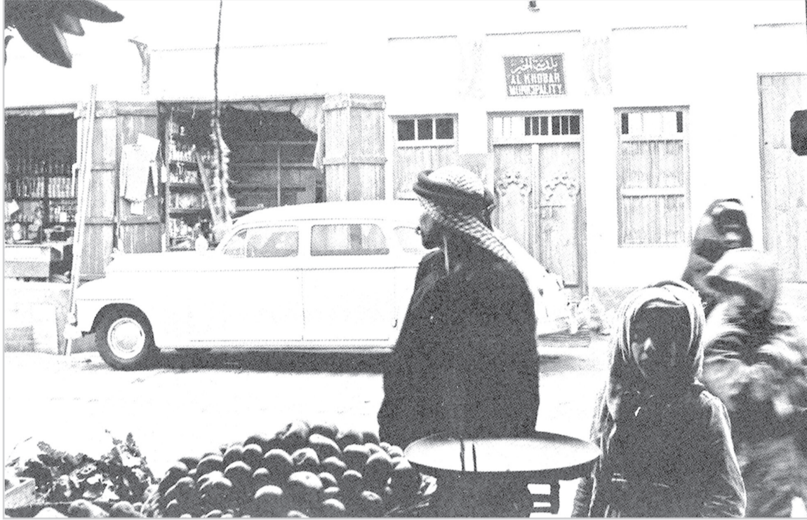
مدينة الخبر من امام مقر البلدية